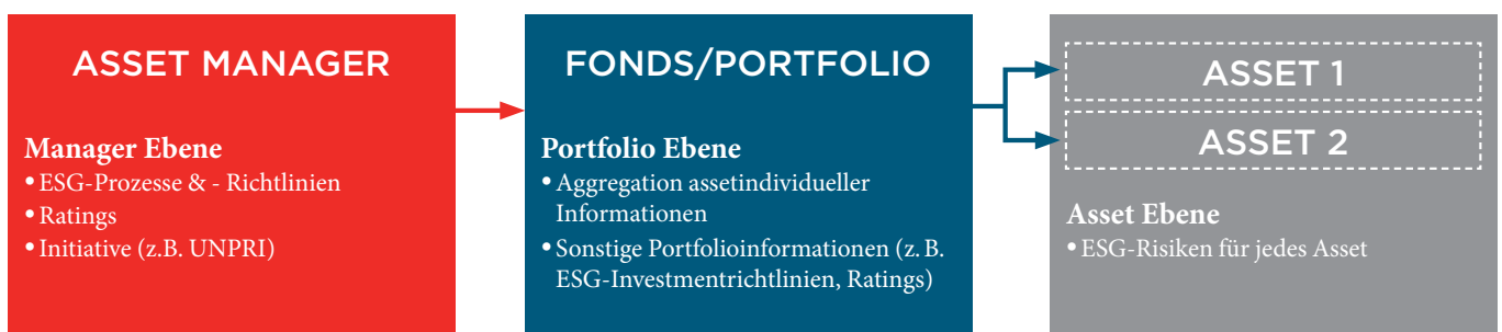
Grafik 1: Ebenen des ESG-Risikomanagements bei Fonds

Bisher wiesen ESG-Fund-Ratings vor allem zwei Mankos auf: Zum einen sind die Ratings von einzelnen Asset Managern oft nicht enthalten, zum anderen sind die Verfahren auf Asset-Owner-Ebene meist nicht standardisiert. Zudem werden bei alternativen Assets selbst entworfene ESG-DDQs (Due Diligence Questionnaires) verwendet. Eine Standardisierung von ESG-Manager-Scorings würde es ermöglichen, Vermögensverwalter einheitlich zu vergleichen und ein laufendes Monitoring gewährleisten zu können.